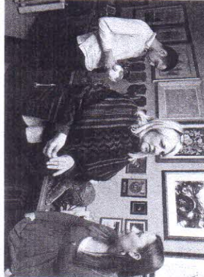
Ovdje ne poštuju

Mi smo svi obavezni da nešto korisno uradimo za svođa života, kaže Divjak