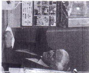
Kalendar sa crtačima starih zanata